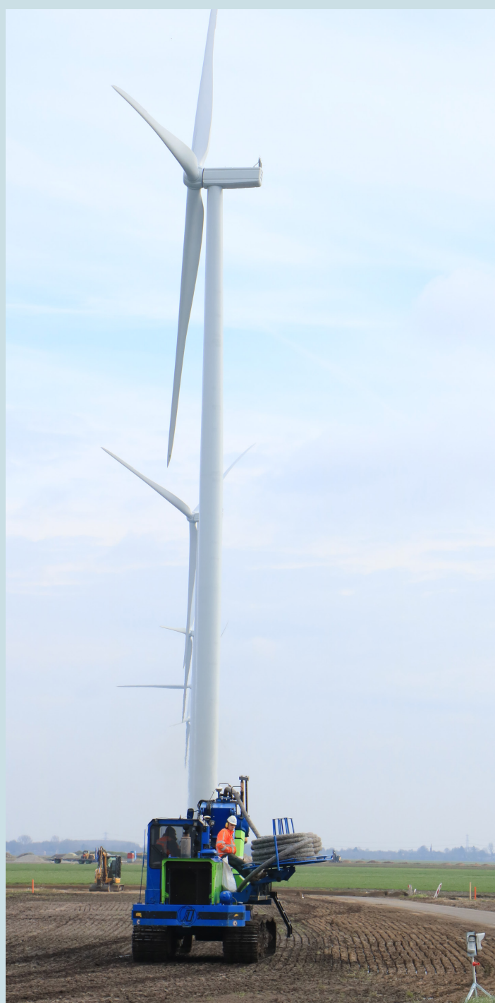
Langs de lijn DEE-1 vordert de aanleg van drainages.

Komende week verhuist de grote hijskraan van de lijn RH-1 naar DEE-2.7. Om een veilige overstek van de Drentse Mondenweg te garanderen zijn verkeerslichten geplaatst.